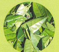
ミヤンの茶葉は日本茶などと同じ ツバキ科の植物