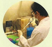
大津栄養製品研究所の 研究風景