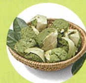
タイ北部で伝統的に 食されている発酵茶ミヤン

乳酸菌B240は、タイ北部で伝統的に食されている発酵茶「ミヤン」から発見された植物由来の乳酸菌です。「ミヤン」は発酵した茶葉そのものを口に入れる「食茶」や「噛み茶」として親しまれ、古くから現地の人々の健康を支えてきました。大塚製薬はその事実に着目し、独自の研究を重ね、乳酸菌B240に体調維持をサポートする働きがあることを確認しました。