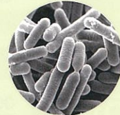
乳酸菌B240 Lactiplantibacillus pentosus ONR1Cb0240

※乳酸菌B240は、東京農業大学が単離し、大塚製薬が体調維持をサポートする働きを確認した乳酸菌です。